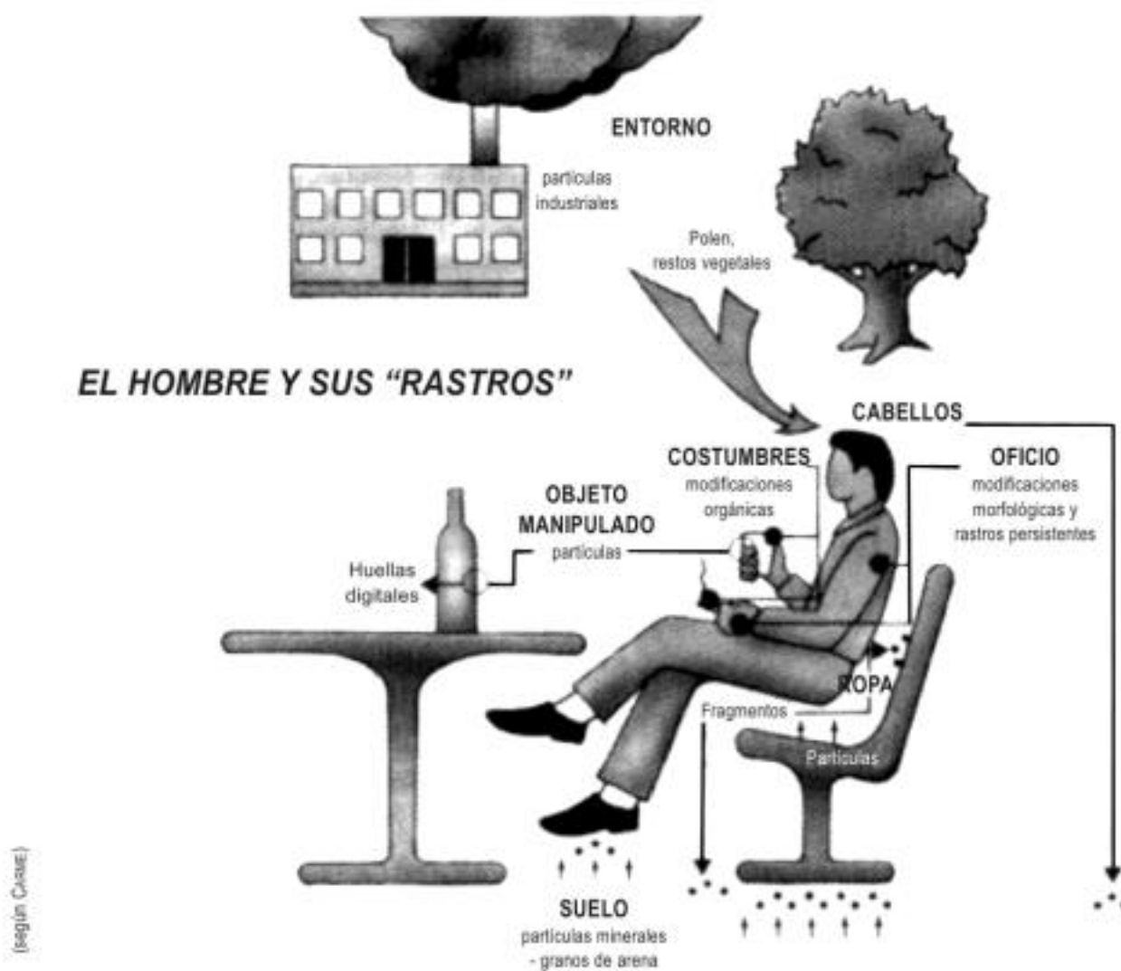
Figura 3.4. — Los rastros dejados por el entorno sobre el individuo, o las modificaciones morfológicas que se deben a su oficio, facilitan en gran medida la identificación. Los dientes, las manos, la piel, la ropa, denuncian ya las costumbres o actividades de cualquiera. De hecho, lo que toma valor de prueba es la acumulación de varios indicios. Uno solo no basta.

Según su naturaleza, se distribuyen en rastros instrumentales, vestimentarios, individuales.